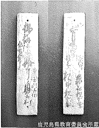
▲荷札（左から表・裏面）