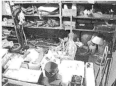
▲民俗資料の整理作業状況