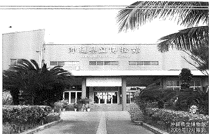
沖縄県立博物館 2006年12月撮影

常設展のメイン・テーマを「海と島に生きる - 豊かさ・美しさ・平和を求めて」にすることに加え、次の3つのコンセプト(1)沖縄の自然、歴史、文化の発信 (2)琉球王朝文化の体系化と人類学研究の拠点 (3)観て、触れて、愛される、動く博物館が提示されています。新館では、この個性豊かな沖縄の自然・歴史・文化に関する資料を収集・保管し、総合的な調査研究を推進し、その成果を展示等とおして内外に発信します。また、沖縄は地質的条件にも恵まれ、港川人をはじめ更新世の人骨、古生物資料が多数発見されています。この自然分野の特性を活かし人類学研究の地方拠点を目指します。そのために新館では、自然史、歴史、考古、民俗、美術工芸に“人類学”を新たに設置し総合博物館としての内容を拡充します。