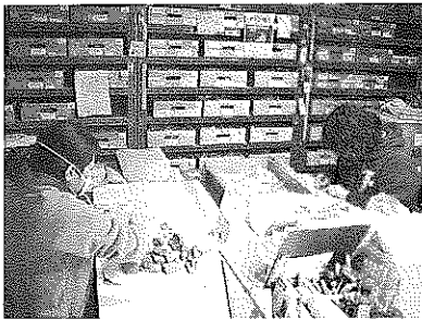
▲考古資料の整理作業状況

収蔵資料は、当館が創設された1946年から蓄積されてきたもので、全てが本県の自然・歴史・文化を継承する貴重な文化財です。創設から60年という歳月が経つこともあり、かつての学芸員らが収集した資料の中からは貴重な資料が発見されることもあり、時に私たち学芸員を驚かせることもあります。これらの資料も含め博物館の収蔵資料は、今後県民の皆様に様々な形で広く公開し、後世に受け継いでいけるよう大切に保管されていきます。