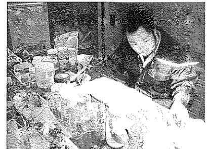
▲自然史資料の整理作業状況