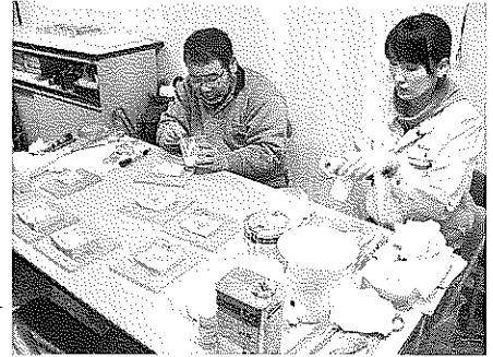
複製品の製作風景▶ (北海道伊達市にて)

そこで、複製品（レプリカ）を製作することになります。複製品の製作作業工程には、大きく分けて事前調査・調整から借用、型取り、検査、返却があり、その都度、所蔵先に出張して対応する必要があります。学芸員は、このような作業のほかにも、ぼう大な展示資料の構成や配置、解説原稿執筆、映像・模型製作等について調整を行い、新館の開館へ向けて作業を進めているところです。