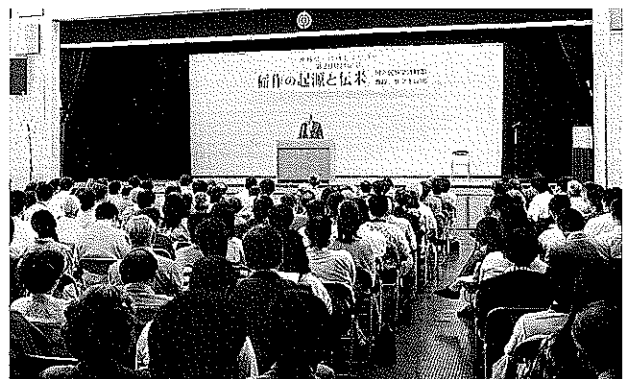
第200回記念文化講座「稲作起源と伝来」1991年4月20日 佐々木 高明(国立民族学博物館教授) 首里公民館大ホール