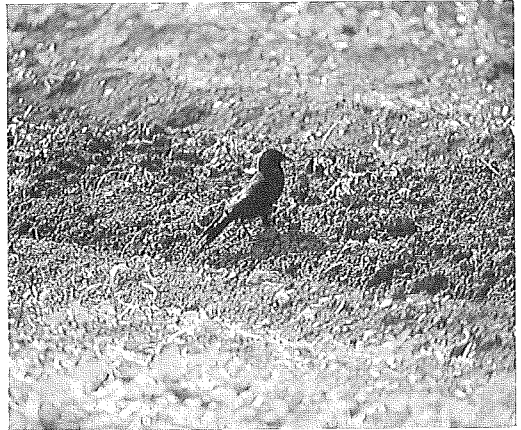
写真2, コクマルガラス Corvus monedula dauuricus