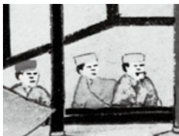
エ. ハチマチをかぶった人