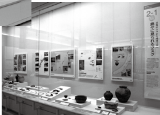
グスク時代の展示品