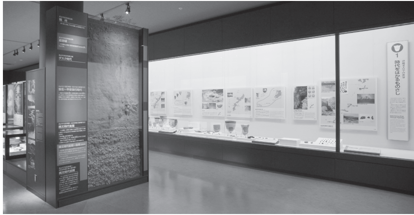
「時代をはかるものさし」のコーナー

3. どうして伊礼原遺跡と前原遺跡では木で作られた物が残っていたのでしょうか。正しいと思う説明の番号を書いてみよう。