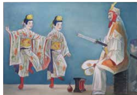
琉球切手原画「二童敵討」