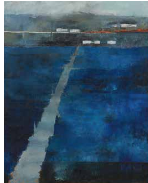
喜久村宏《海中道路》1976年 KIKUMURA Hiroshi Road in the Sea (1976)