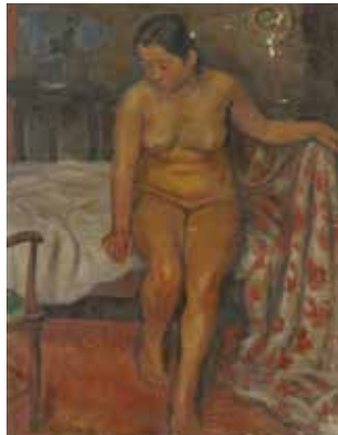
斧山萬次郎《裸婦》1935年頃 ONOYAMA Manjiro A Nude (ca.1935)