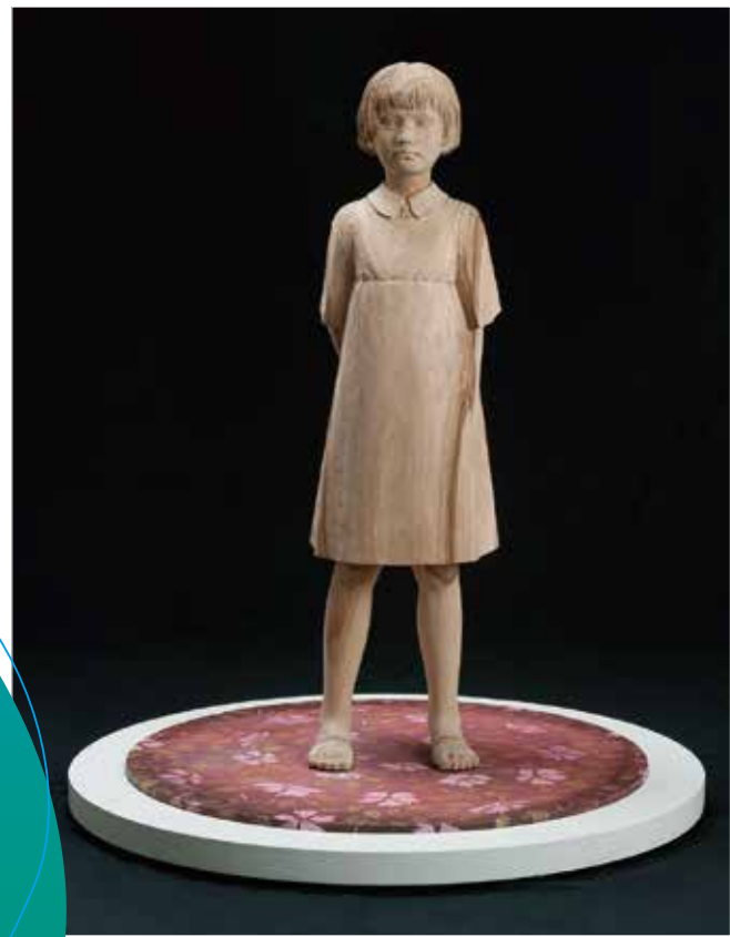
儀保克幸《ここにいるわたし》2009年 GIBO Katsuyuki Here I am (2009)