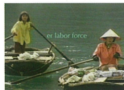
トリン・T・ミンハ (ベトナム) 「Old Land New Waters」