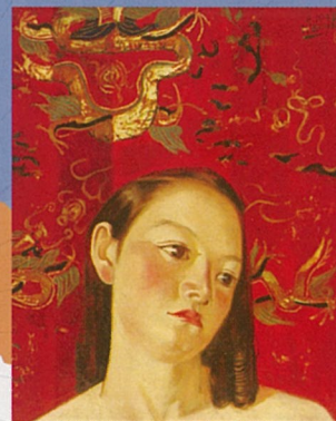
安次嶺金正「白い布と少女」