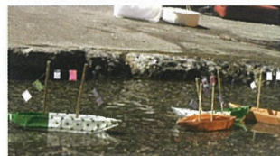
照屋勇賢 (北米) 「儲キティクローヨー、手紙アトカラ、銭カラドサチドー」