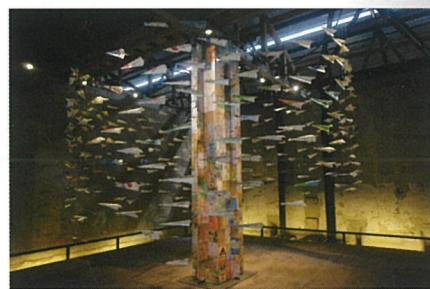
鄒素芬 (台湾) 「F-36飛行計画」