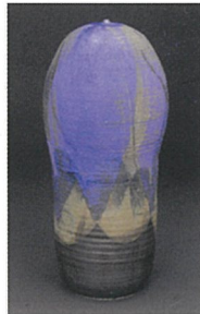
トシコ・タカエズ (北米) 「untitled」