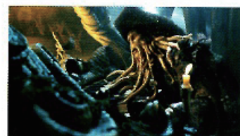
「パイレーツ・オブ・カリビアン: デッドマンズ・チェスト」(2006年) フィルム・フレーム