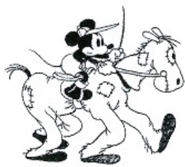
「ミッキーの障壁物競争」(1933年) パブリシティ・アート