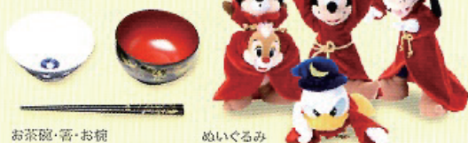
お茶碗・箸・お椀