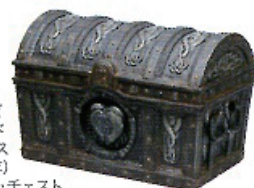
「パイレーツ・オブ・カリビアン: デッドマンズ・チェスト」(2006年) デッドマンズ・チェスト ジョニー・デップとビル・ナイが使用したもの