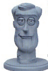
「トイ・ストーリー」(1995年) ウッディ