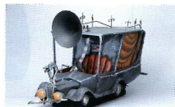
「ナイトメア・ビフォア・クリスマス」(1993年) 町長の車