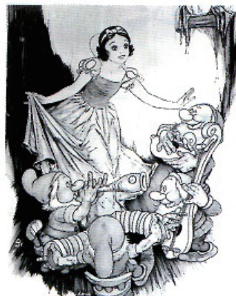
「白雪姫」(1937年) パブリシティ・アート