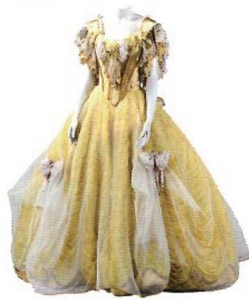
「美女と野獣」ブロードウェイ版(1998年) ベルのドレス トニー・ブラクストンが着用したもの