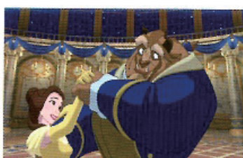
「美女と野獣」(1991年) フィルム・フレーム