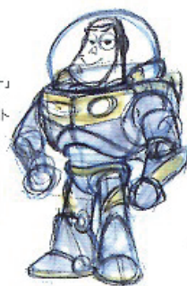
「トイ・ストーリー」(1995年) コンセプト・アート

ミッキーマウスの生みの親であり、「白雪姫」や「ピノキオ」「シンデレラ」など数多くの長編アニメーションを世に送りだし、個人では最多のアカデミー賞®受賞を誇るウォルト・ディズニー(1901-1966)。1923年に創業したウォルト・ディズニー・カンパニーがミッキーマウスを誕生させてからおおよそ50年後、夢を追い求める人々にインスピレーションを与え続けられるように、ウォルトとその会社に関する史料を収集・保存する「ウォルト・ディズニー・アーカイブス」が設立されました。本展では、アーカイブス監修のもと、ミッキーマウスから実写作品の「パイレーツ・オブ・カリビアン」、また「モンスターズ・インク」などのピクサー作品まで、90年間に創り出されたアートや小道具類、コスチューム、模型のほか、セル画やフィギュアなど約800点を一堂に展覧いたします。未来に向けて創造し続けるディズニーの世界をお楽しみください。