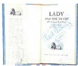
「わんわん物語」ウォルト・ディズニーのサイン入り(1953年出版)