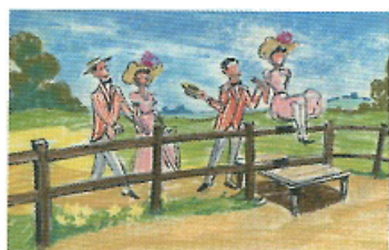
「メリー・ポピンズ」(1964年) コンセプト・アート