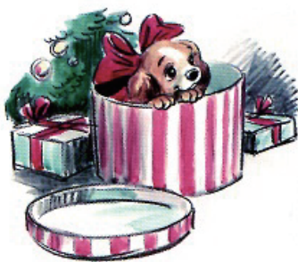
「わんわん物語」(1955年) ストーリー・スケッチ