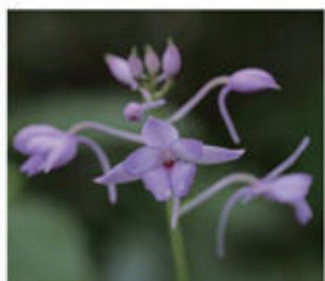
オナガエビネ

沖縄は島という環境、温暖で湿潤な亜熱帯海洋性気候、地殻変動による列島形成の過程などによって、多種多様な生物相が形成されてきました。日本の面積の0.1%に満たない“やんばるの森”には、ヤンバルクイナ、オキナワイシカワガエル、ヤンバルテナゴコガネなどの動物、オキナワセッコク、コバノミヤマノボタンなどの植物といった数々の固有種が生息しています。国立公園に指定され、世界自然遺産登録候補地のひとつとして今注目を浴びている“やんばるの森”、そこに生きる貴重な野生動植物やそれらを育む美しい自然が持つ“美”を数々の写真をとおしてご紹介します。