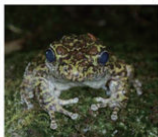
オキナワイシカワガエル