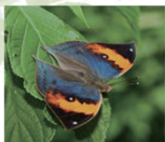
コノハチョウ