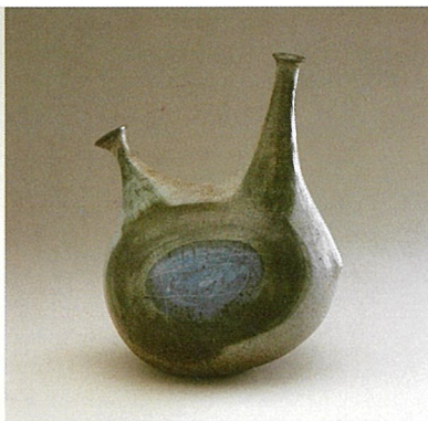
Two Spouted Bottle