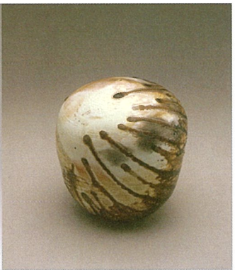
Anagama Closed Form