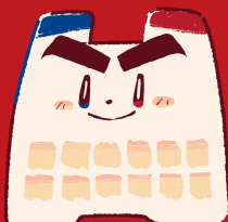
おきみゆーちゃん