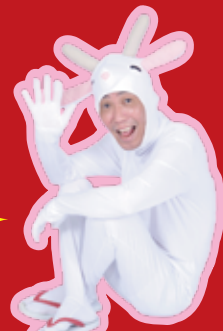
やぎのシルーさん