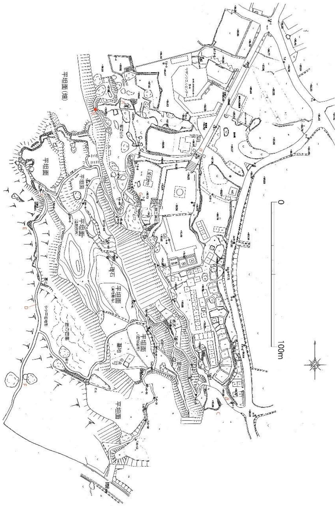
与論グスク縄張り図