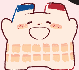
「おきみゅー公式キャラクター」 おきみゅーちゃん