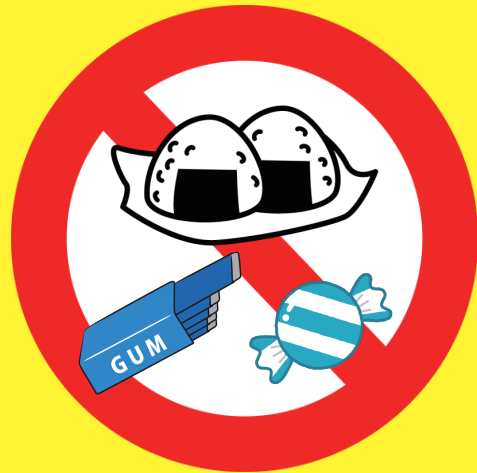
食べ物 (小麦粉など)