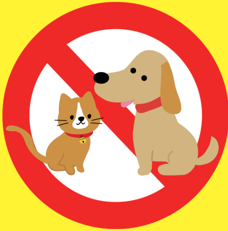
動物類 (介助犬を除く)