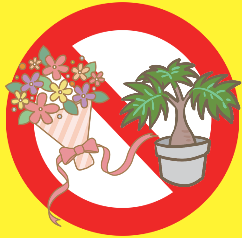
植物類 (花束や観葉植物など)