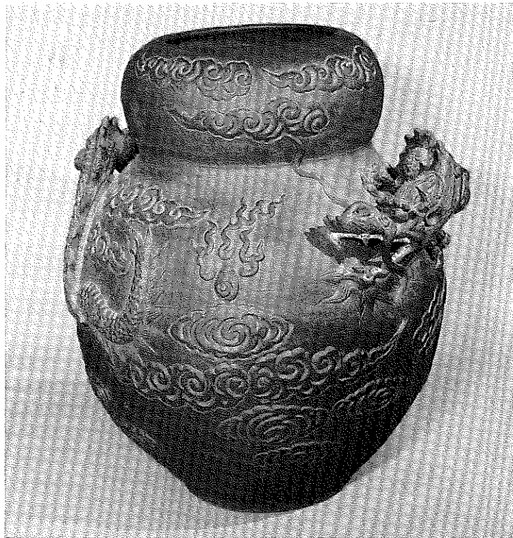
龍雲盛付達磨型大花瓶（高59.0×口径21.0×底径22.0）