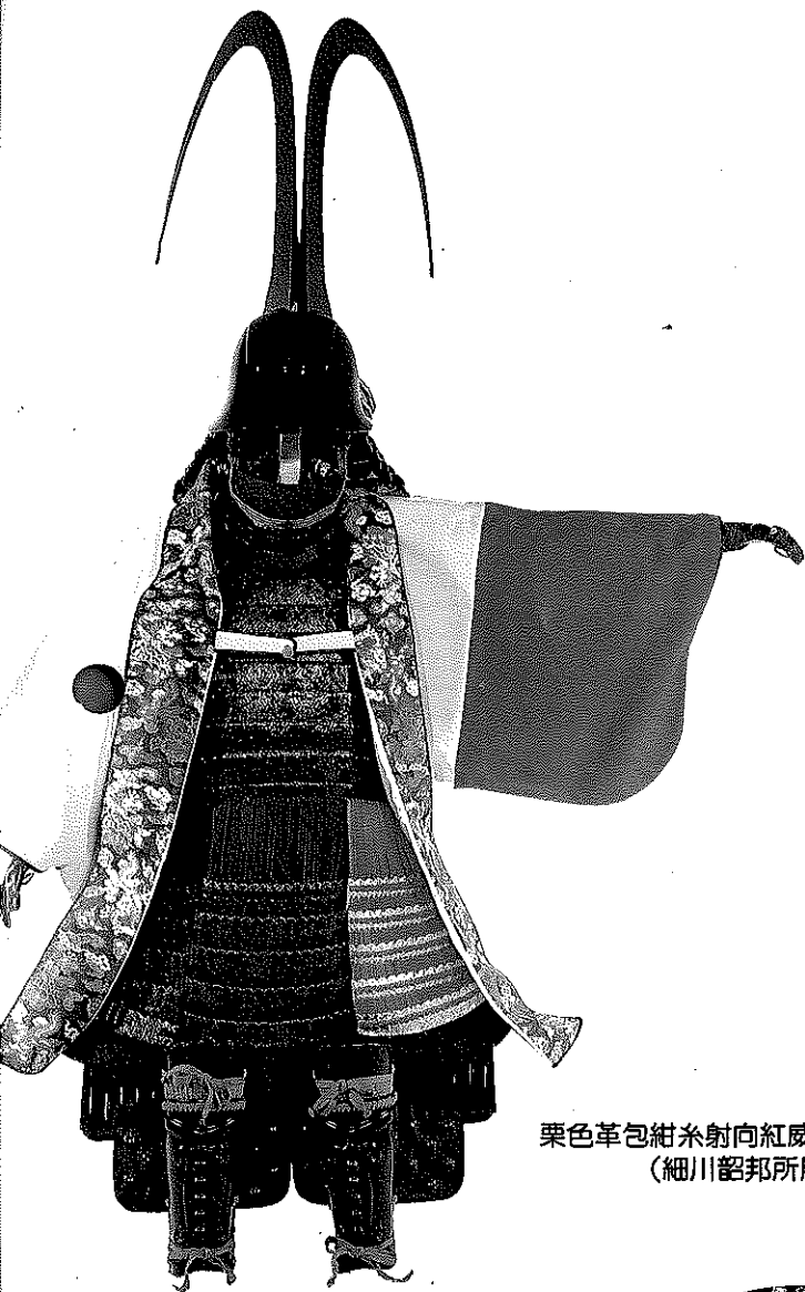
栗色革包紺糸射向紅威二枚胴具足 (細川韶邦所用)