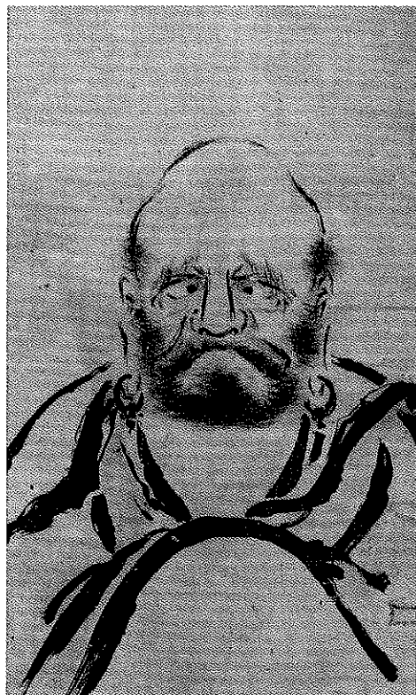
正面達磨図(宮本武蔵筆)江戸時代