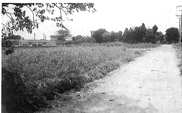
写真1 学校の裏から港の方へつながる道路。この道を利用して御真影が小浜国民学校へ下賜された。