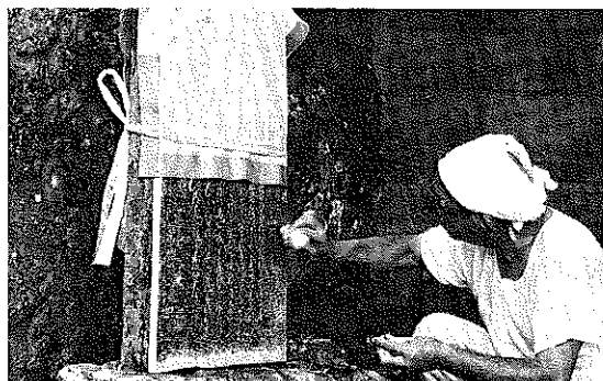
採 拓 風 景

戦前、本県には那覇・首里を中心として、多くの梵鐘や石碑・墓碑などの金石文が存在した。これらの金石文は、寺社建造の際に鑄造された梵鐘、橋を築造した際に建立される石碑など、社会的なできごとや記念すべき事業を完成したり、特定の歴史上の人物を顕彰し、あるいはある事象の縁由・来歴を刻して、後世に伝えるために造られたものである。しかし、これらの金石文の大半は今次大戦で消失・破壊され、現存するものはきわめて