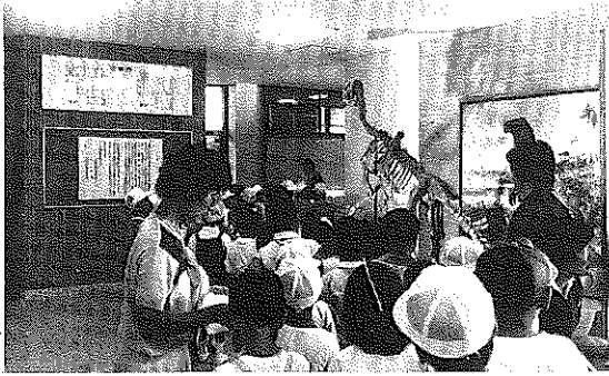
伊江村の会場において

当館は、離島・僻地の多い本県において、博物館として何ができるのか、それを創立以来の課題の1つとしてきました。その試みのひとつとして、昭和54年に久米島で第1回目の「移動博物館」を実現しました。