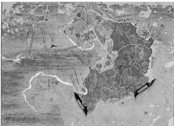
琉球図惣絵図 (間切集成図) : 大里間切・佐敷間切・知念間切・玉城間切