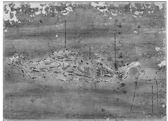
琉球国惣絵図（間切集成図）：伊平屋間切（伊平屋島）