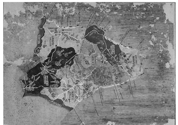
琉球図惣絵図 (間切集成図) : 喜屋武間切・高嶺間切・真壁間切・兼城間切・東風平間切・摩文仁間切・具志頭間切