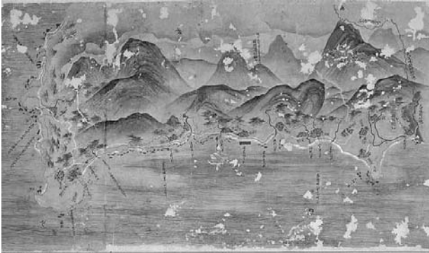
琉球図惣絵図 (間切集成図) : 国頭間切