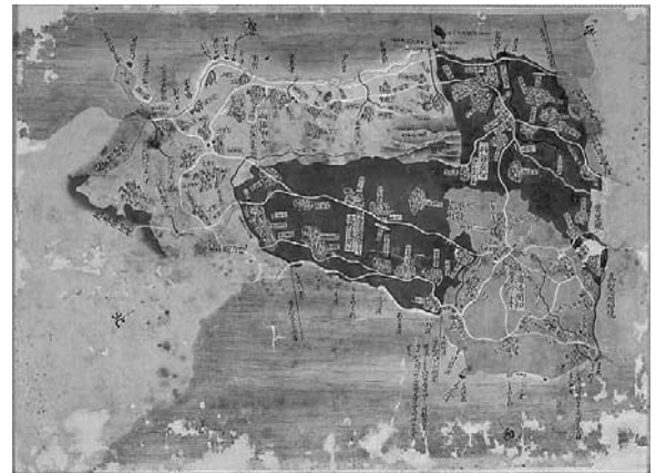
琉球図惣絵図 (間切集成図) : 中城間切・宜野湾間切・浦添間切・西原間切