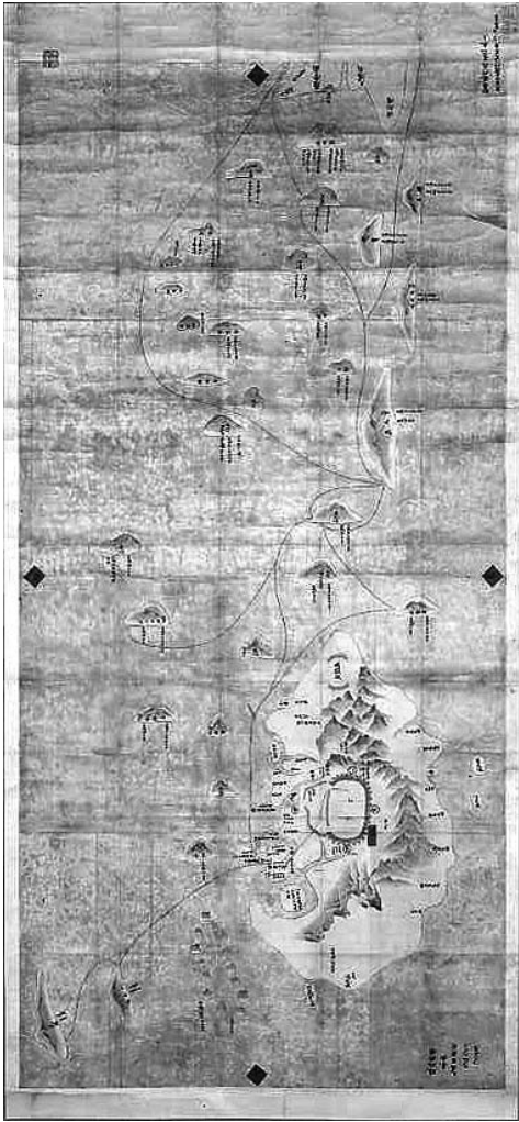
琉球地図（琉球国図）全体