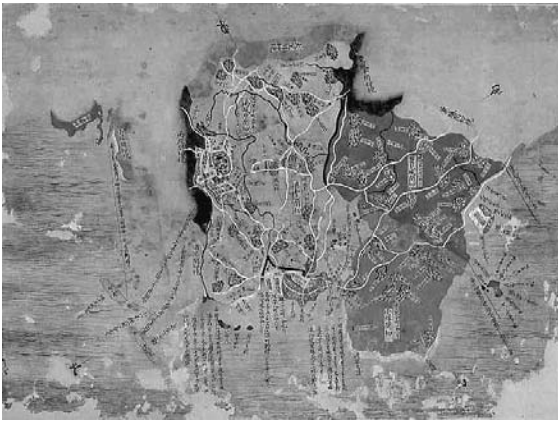
琉球図惣絵図 (間切集成図) : 首里・那覇・泊村・久米村・南風原間切・豊見城間切・真和志間切・小禄間切