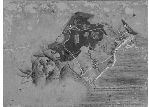
琉球図惣絵図 (間切集成図) : 北谷間切・越來間切