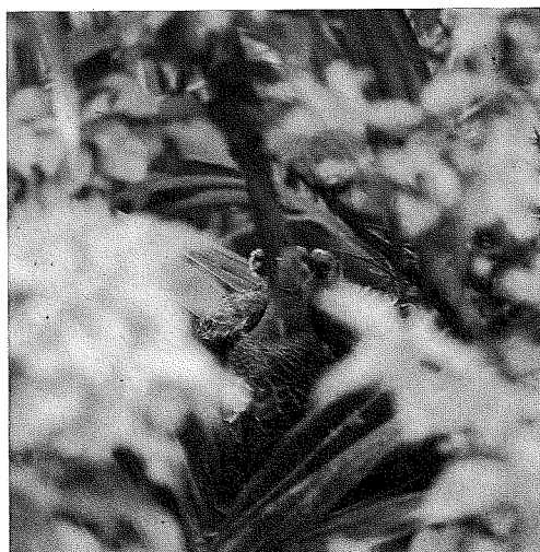
写真② 雛に給餌するキジバトの親鳥