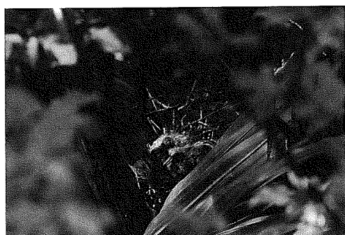
写真① キジバトの雛

親鳥は概ね午前10時30分頃から同11時20分頃までに帰巢し、雛と向かい合って巢の中に座った後で頭頸部を動かし、餌を戻すと嘴を大きく開いた。雛は直ちに嘴を親鳥の口内部に入れ、餌 (pigeon milk) を飲み込んでいた。雛2羽への給餌時間は約4分間で終了した。給餌後、親鳥は抱雛するが、2羽の雛は3~10分間で就眠してしまうようである。その後、雛が産座で昏睡状態に入ってしまうと、親鳥は抱雛を中止して巢の中から飛去してしまった。放置された2羽の雛は産座で起き上がることもなく、そ