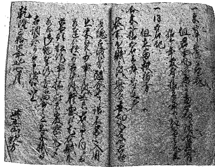
具志川間切所遣賦