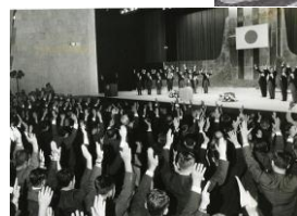
日本復帰式典