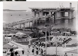
アクアポリス