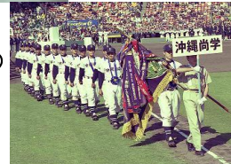
沖縄尚学 センバツ初優勝