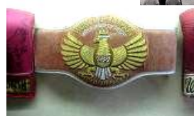
具志堅用高 チャンピオンベルト (具志堅用高記念館蔵)