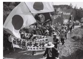
祖国復帰大行進団 (沖縄県公文書館蔵)